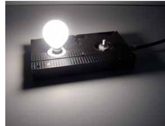
Cristina Allende. Workshop diseño industrial.

Se realizarán talleres que abarcarán semanas completas, dedicados a la experimentación e impartidos por expertos profesionales. Se plantearán como ejercicios prácticos intensivos para entender mejor cada materia. Áreas a desarrollar: moda, diseño de producto, diseño de interiores, diseño gráfico, y comunicación.