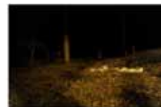
IED Design • Curso de 1 año: fotografía