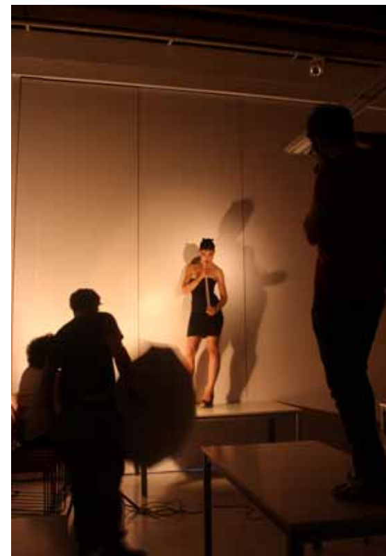
IED Design • Curso de 1 año: fotografía