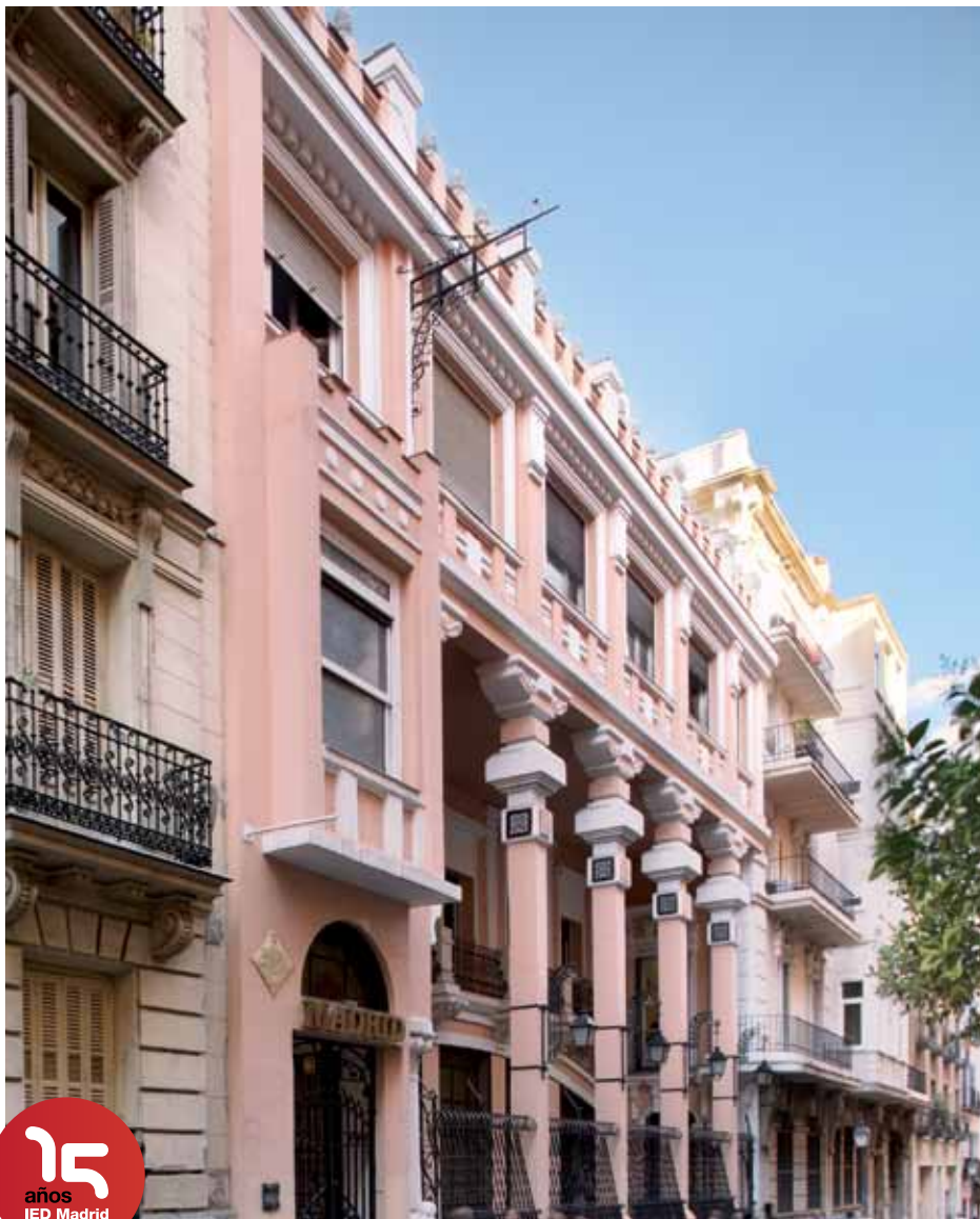
Sede IED Master Madrid Calle Larra 14