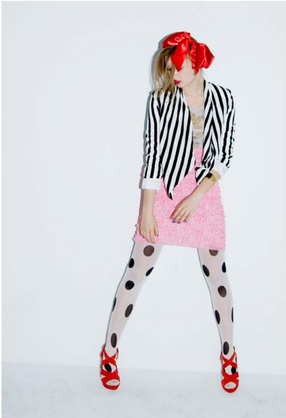
Curso de Especialización de Estilismo de Moda. Trabajo de alumnos 2ª convocatoria 2009/2010