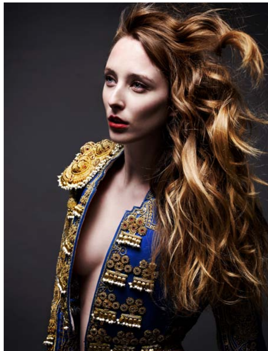
Trabajo de alumnos de la 2ª convocatoria del Curso de Especialización de Estilismo de Moda 2009-2010.

Glamour (Ed. Condé Nast). Editora de moda. Nova (Hachette Filipacchi). Jefa de moda.