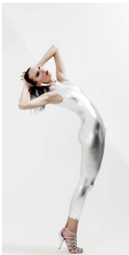
Trabajo de los alumnos de la 2ª convocatoria del Curso de Especialización de Estilismo de Moda 2009-2010.