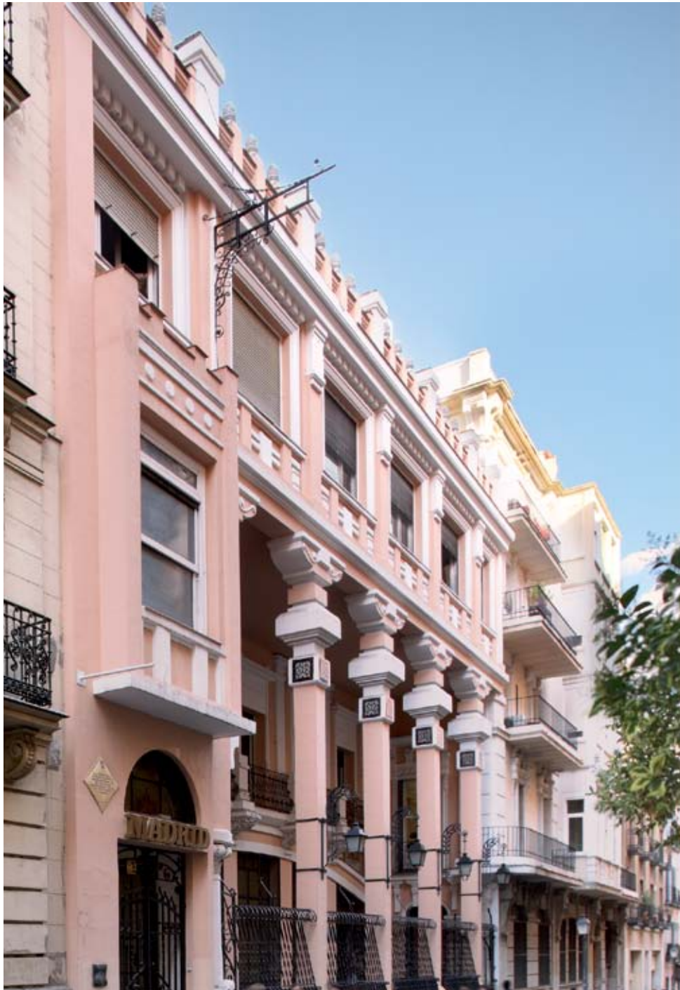
Sede IED Master Madrid Calle Larra 14