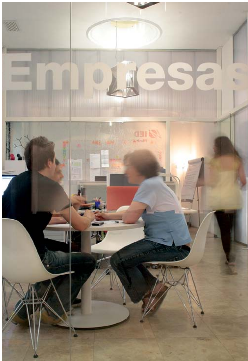
Departamento IED Empresas