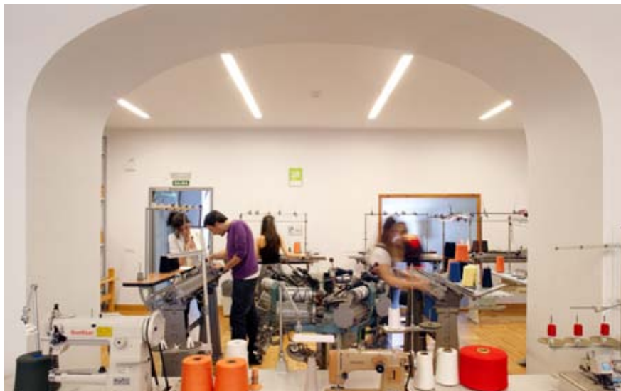
Alumnos del Máster de Diseño Textil y de Superficies trabajando en el taller de Punto

En los proyectos didácticos del IED Master Moda Lab, se trabaja el concepto de identidad de la moda desde distintas perspectivas: la creación y producción de una marca propia, el diseño de una colección, diseño textil y superficies, diseño de accesorios, dirección y gestión de empresas moda. Dentro de cada uno de los programas de IED Master, una amplia área transversal ofrece talleres, workshops, trabajos entre disciplinas y un cuerpo docente compuesto por profesionales en activo de alto nivel , lo cual proporciona a los alumnos una experiencia estimulante y enriquecedora para su posterior proyección profesional.