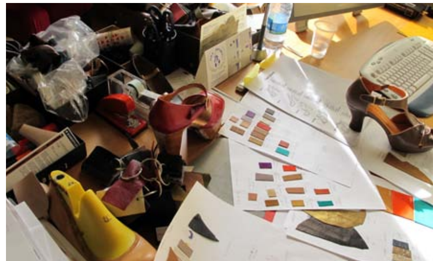
Fotografía realizada durante el Máster de Accesorios de Moda 2009-2010 del IED Madrid

El desarrollo de la imagen y la necesidad de asesoramiento, constituyen un terreno que, dentro de la moda, alcanza una mayor proyección laboral.