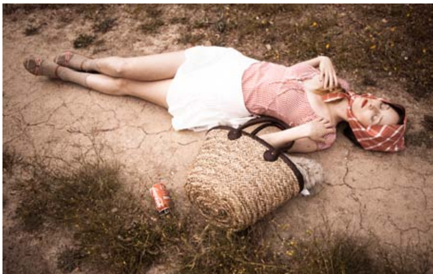
Trabajo de los alumnos del Curso de Especialización de Estilismo de Moda 2009-2010

Resumiendo, podríamos definir Estilismo como parte de todo un criterio estético para innovar en la creación de imágenes de carácter contemporáneo, en el que técnica y conocimiento se fusionan y retroalimentan gracias a la fotografía como comunicadora de conceptos y la imagen, como estudio, técnica y vanguardia.