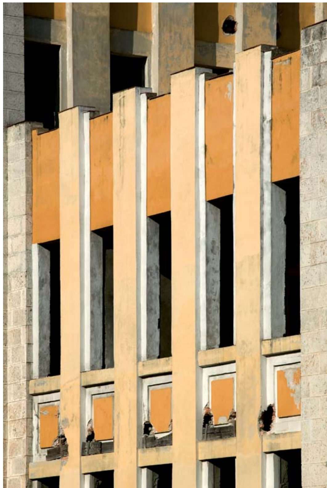
HOSPITAL, VEDADO, 1930. 2008. Fotografía sobre aluminio 120x88 cm Photograph on aluminium 120x88 cm