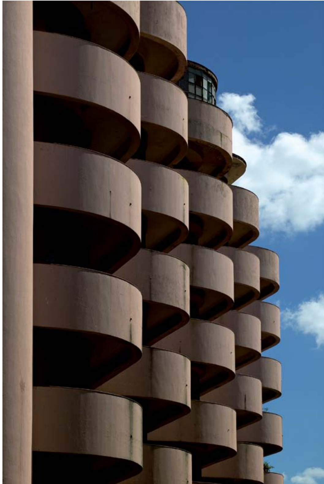
EDIFICIO SOLIMAR, 1945. 2008. Fotografía sobre aluminio 120x88 cm Photograph on aluminium 120x88 cm