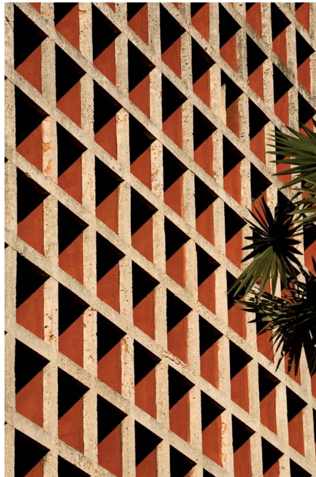
CALLE 23, # 565. 2008. Fotografía sobre aluminio 120x88 cm Photograph on aluminium 120x88 cm