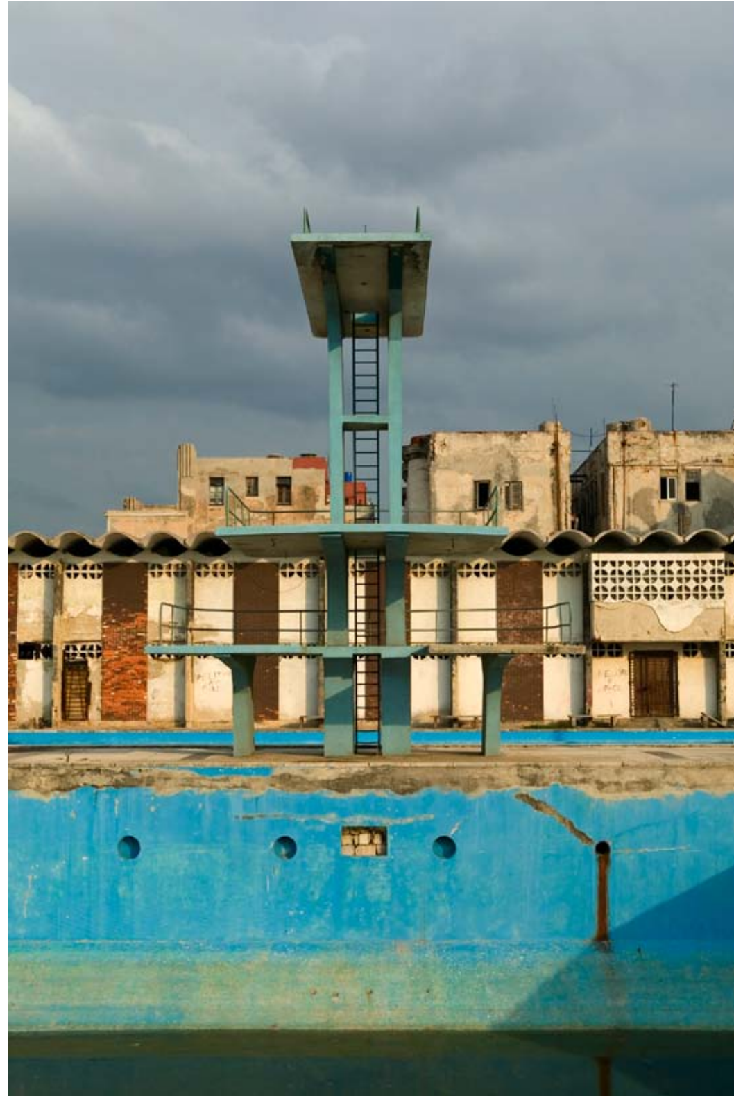
PISCINA EN VEDADO. 2008. Fotografía sobre aluminio 120x88 cm Photograph on aluminium 120x88 cm