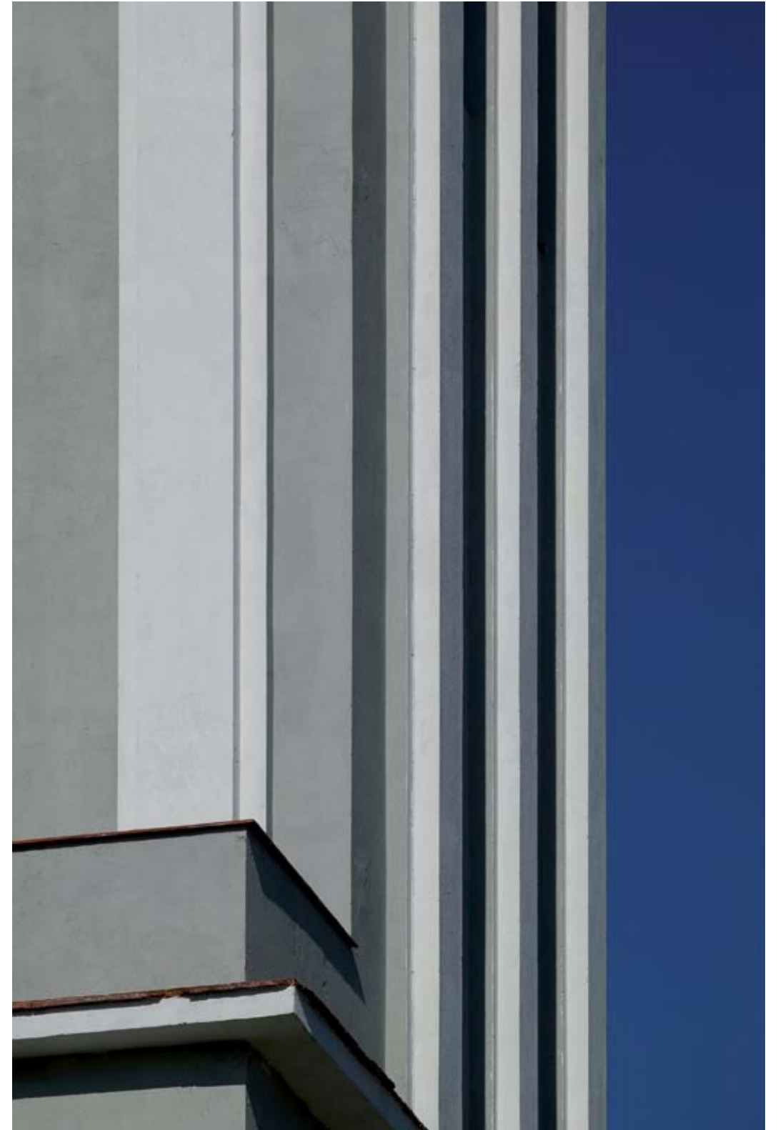
CASA DE LAS AMÉRICAS. 2008. Fotografía sobre aluminio 120x88 cm Photograph on aluminium 120x88 cm