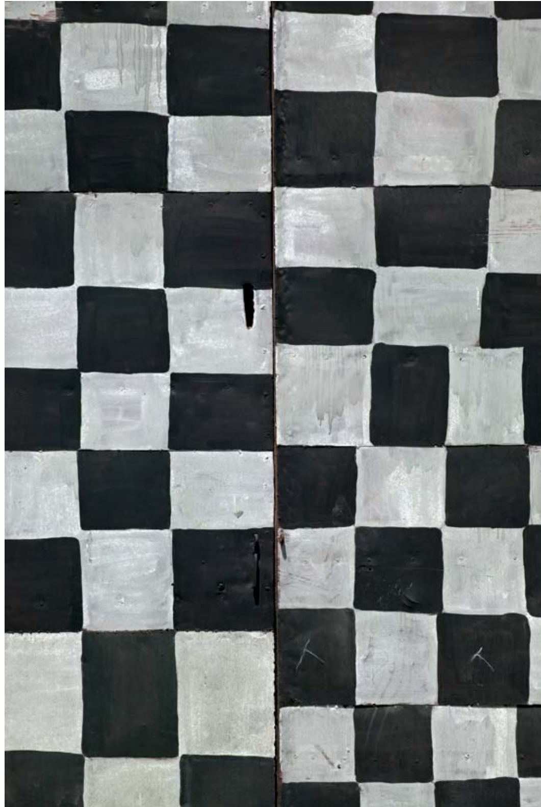
GARAJE, CALLE SOLEDAD. 2008. Fotografía sobre aluminio 120x88 cm Photograph on aluminium 120x88 cm