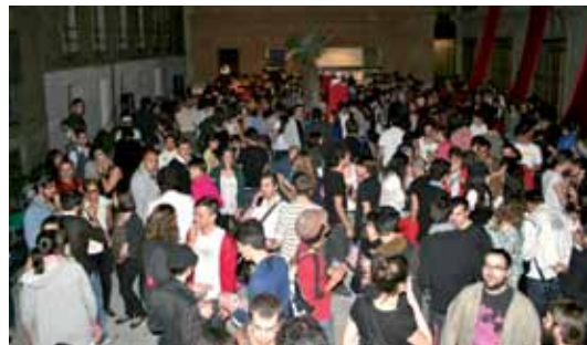
FIESTA REVISTA FANZINE 137_MADRID