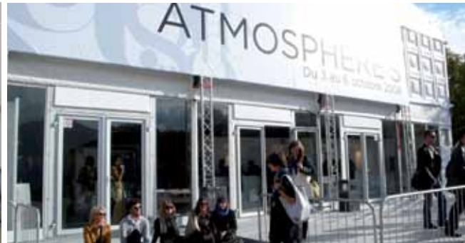
VIAJE PARIS FASHION WEEK_PARIS