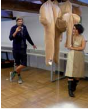
WORKSHOP HENRIK VIBSKOV_COPENHAGUE