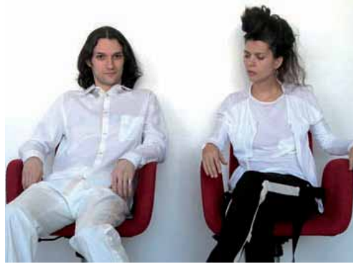
CONFERENCIA SANS_NUEVA YORK