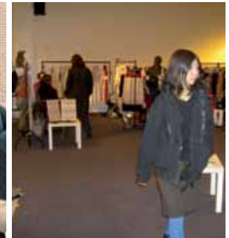
BECA SALÓN RENDEZ VOUS_PARIS