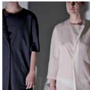
PROYECTO ANNE VALERIE HASH_PARIS