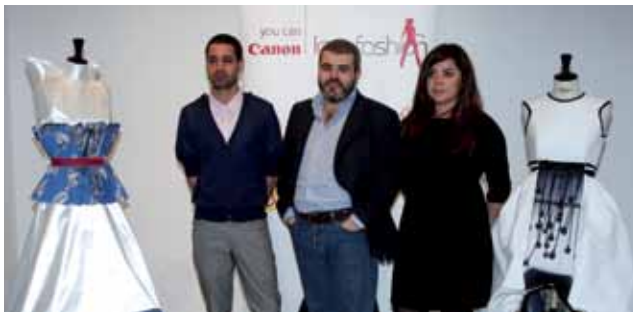
CONCURSO CANON + LONDON FASHION WEEK + LORENZO CAPRILE