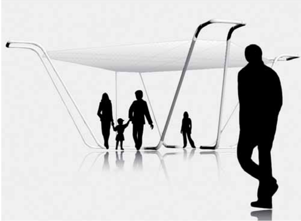
1. MEETING POINT FIB_LETICIA DE RAMÓN, ÁLVARO APARICIO Y BEN FRANKFORTER | 2. CERAMIC PC_ALUMNOS 2º INDUSTRIAL 2 | 3. SILLA EXCOMUNIÓN_MÁXIMO ROMANILLOS