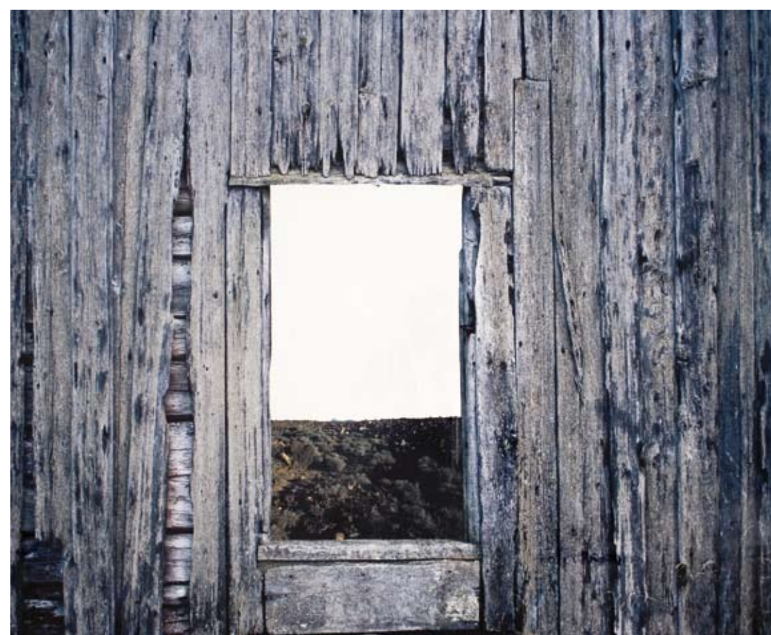
MONTSERRAT SOTO, S.T. (ventana madera 5). Fotografía color. 120 x 100 cm. 2001