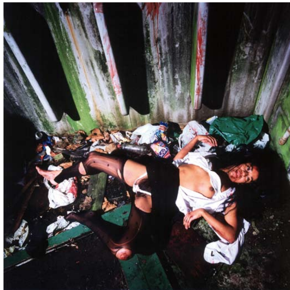
JUAN DELGADO, Unitled #7 (de la serie "The Wounded Image"). Fotografía color sobre aluminio. 100 x 100 cm. 2002