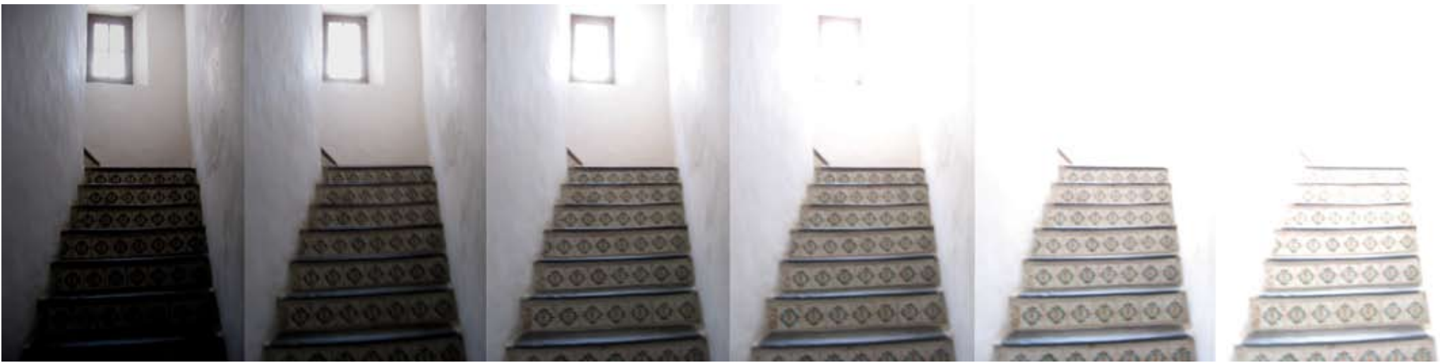
ALFREDO JAAR, Nude descending the staircase. Clichéchrome. 98 x 131 cm. 2004