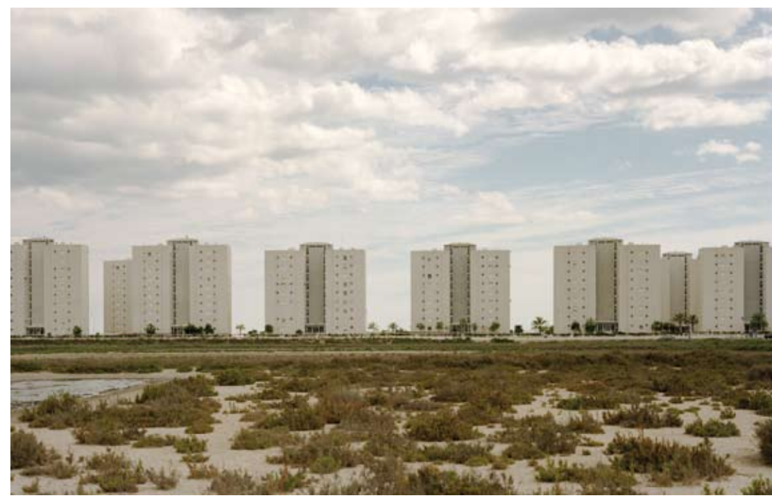
SEBASTIÁN BELINCHÓN, S.T. (de la serie "Ciudades efímeras"). Fotografía color. 100 x 140 cm. 2001