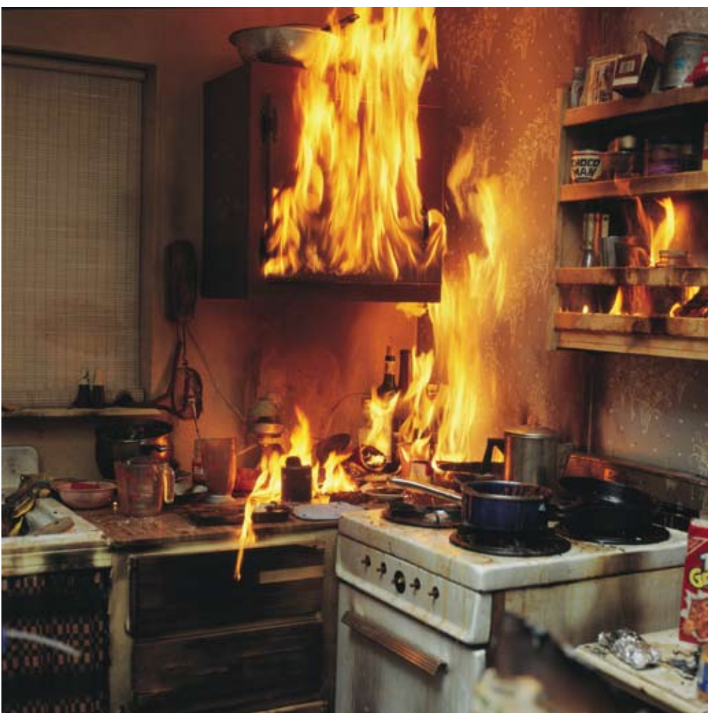
PATRICK JOLLEY/REYNOLD REYNOLDS, Burn. Video 10'31". 2002