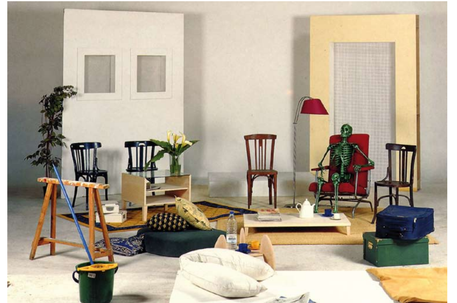
MIRA BERNABEU, Los milagros del cuerpo. Tronco XI (de la serie "Misa en Soñol 8"). Fotografía color. 125 x 180 cm. 2000