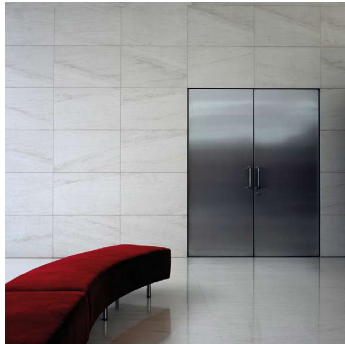
LORENZO USAS DUBREUIL, Museo 1. Fotografía color sobre aluminio. 140 x 140 cm. 2006