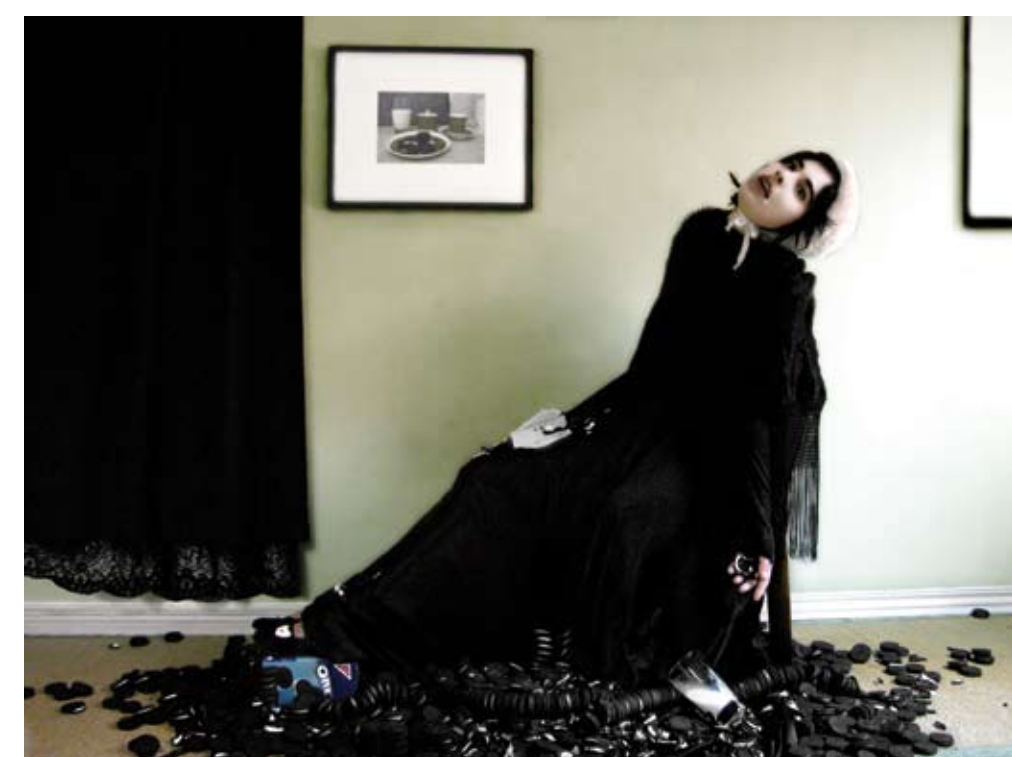
DANIELA EDBURG, Muerte por orcas. Fotografía color. 100 x 100 cm. 2000