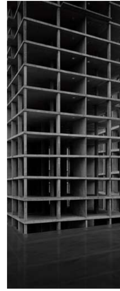
ALFONSO QUINTERO, Descomulgación. Fotografía color. 100 x 100 cm. 2000