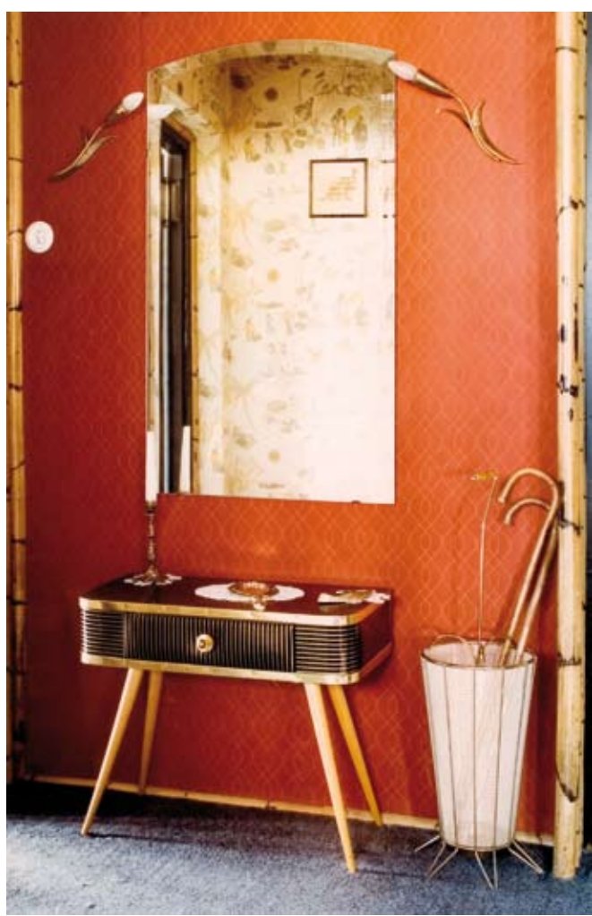
THOMAS RUFF, Interview 2D. Fotografía color. 80 x 40 cm. 1980