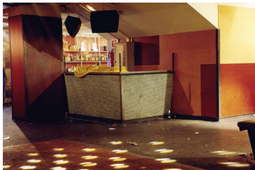
CABELLO/CABELLER, Algunas partes # 5. Fotografía color. 125 x 180 cm. 2000 - 2002