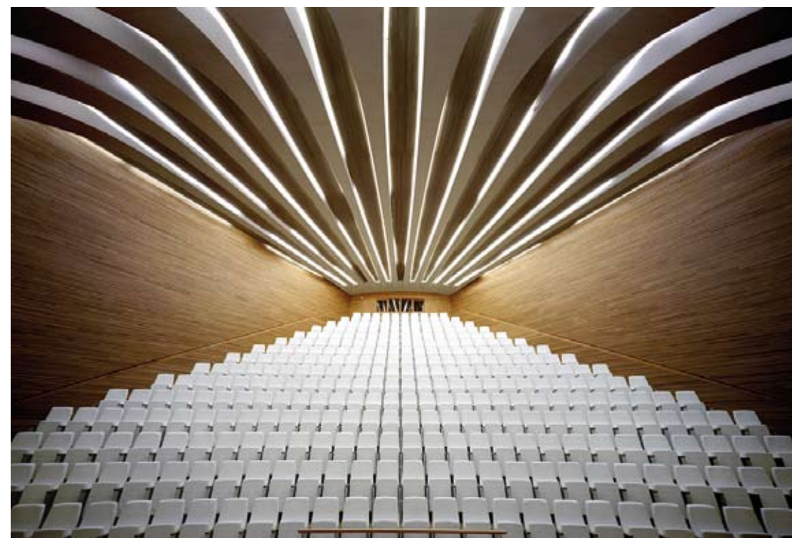
RAÚL BELINCHÓN, Palacio de las artes. Sala 2. Clichéchrome. 125 x 180 cm. 2000